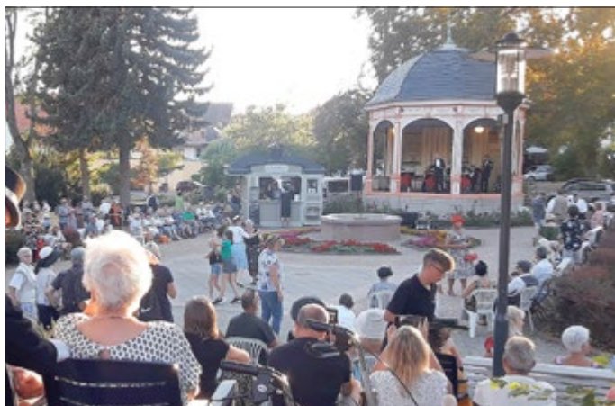
Impressionen vom Kurkonzert und Kurmilieu 2022

Am Mittwoch, dem 21. August 2024, findet wieder das beliebte „ Kurkonzert & Kurmilieu “ statt.