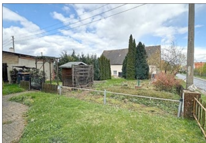
Gartenfläche mit Schuppen, Wiese und Pflanzbereichen