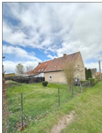
Gartenfläche links vom Haus

Für Rückfragen wenden Sie sich bitte per E-Mail an: info@anderschmuecke.de.