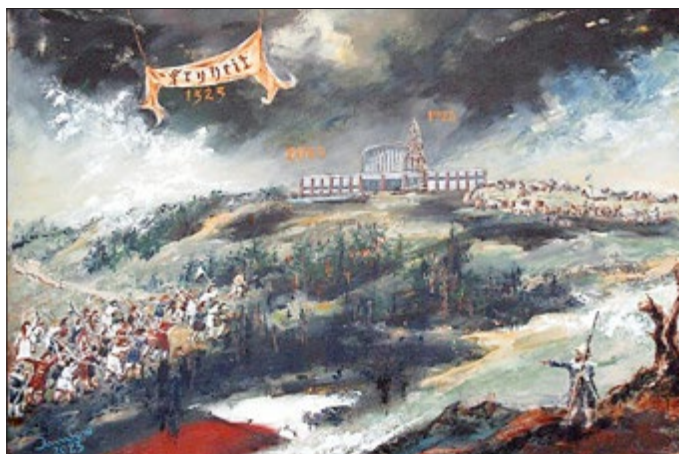
Dieter Juntow, Schlachtberg - trigonometrischer Punkt, 2023

Dieter Juntow ist im östlichen Teil des Kyffhäuserkreises, der Stadt Roßleben-Wiehe, zu Hause.